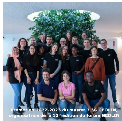
Promotion 2022-2023 du master 2 3G GEOLIN, organisatrice de la 13 e édition du forum GEOLIN